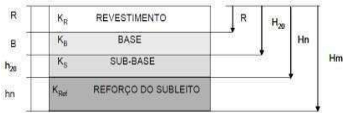
Figura 03. Dimensionamento de pavimento flexível